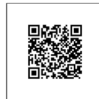
Zažádejte o vytyčení